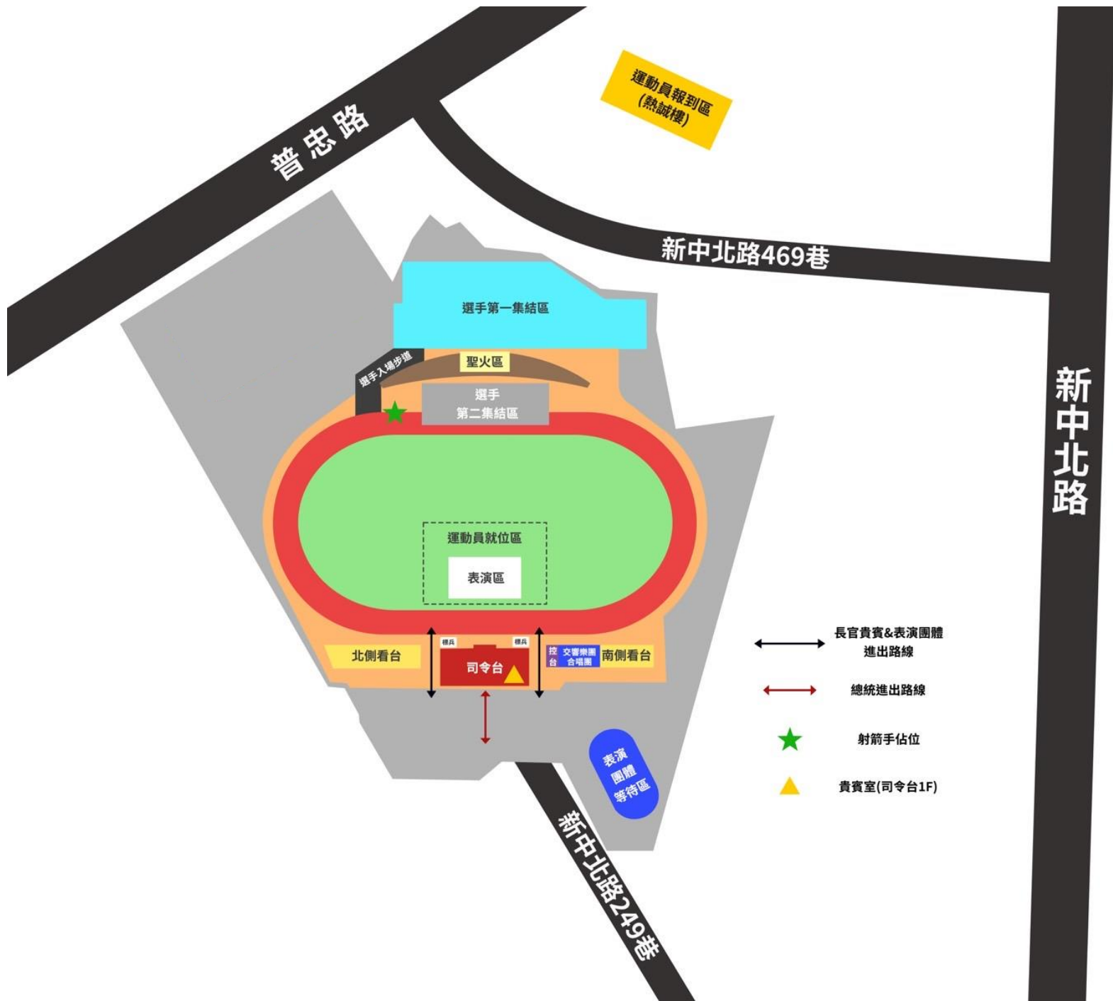
附件2、運動員進場動線及位置圖