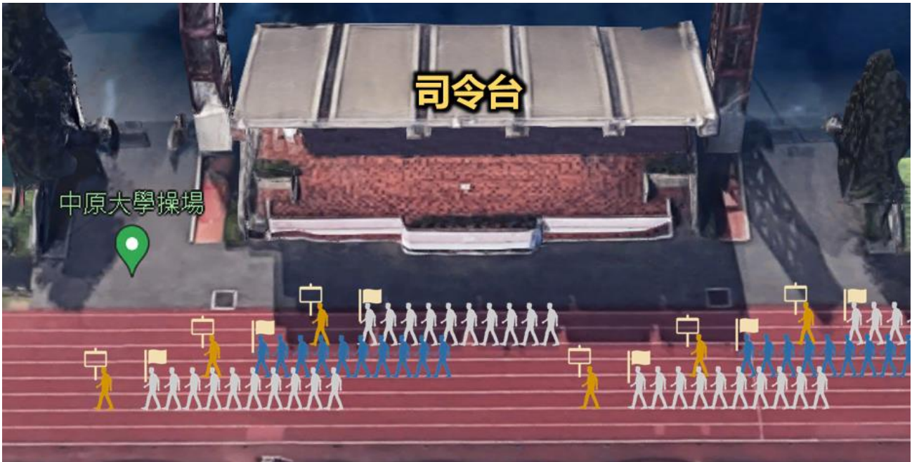
圖-進場隊形示意圖

(二)各校隊伍順序為：單位牌(大會舉牌手)1名、校旗(各校掌旗官)1名、領隊1名、教練暨隊職員與運動員至多8人，示意圖如下圖：